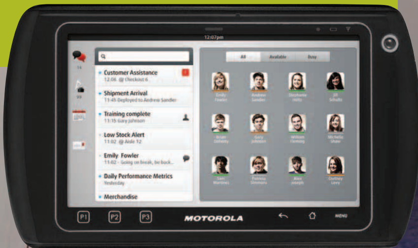
TABLEAU DE BORD POUR LES MANAGERS: DU BOUT DES DOIGTS, VOS MANAGERS ACCÈDENT À TOUT CE DONT ILS ONT BESOIN POUR GARANTIR LE BON FONCTIONNEMENT DE VOTRE MAGASIN.